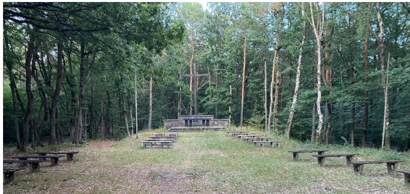
Belle Kreuz im Binger Wald in der Gemarkung Weiler

Das Bündnis der Gemeinden Churches for Future Bingen organisiert nun zusammen mit dem Forstamt Boppard im Weilerer und Binger Wald eine kostenfreie Waldbegehung für alle, die sich über den tatsächlichen Zustand unseres Waldes in Zeiten der Klimakrise informieren möchten.